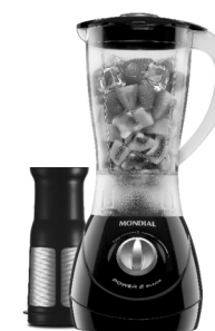
L-38 – Power 2 Black Filter 2 Vel. Copo SAN