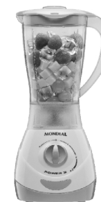
NL-32 – Power 3 3 Vel. Copo SAN