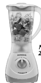
NL-22 – Power 2 2 Vel. Copo SAN