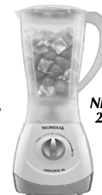
NL-26 – Power 2i 2 Vel. Copo PP inquebrável