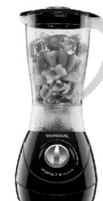
L-28 – Power 2 Black 2 Vel. Copo SAN