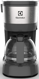
Fotos e desenhos ilustrativos CAFETEIRA_ECM10_PORT_REV00