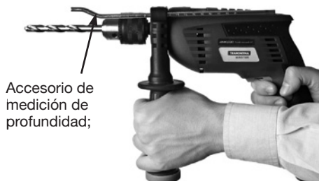
Accesorio de medición de profundidad;