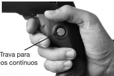
Botão Trava para trabalhos contínuos

duração, pode-se utilizar o botão de trava. Após pressionar o gatilho, aperte o botão de trava para manter a ferramenta em funcionamento sem a necessidade de exercer pressão no gatilho. Pressione o gatilho novamente para desativar essa função.