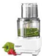
Processadores de Alimento