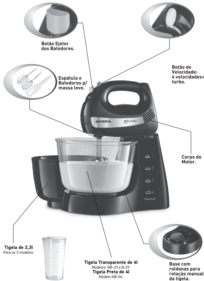
Copo Dosador *Somente modelos: NB-23 e B-29