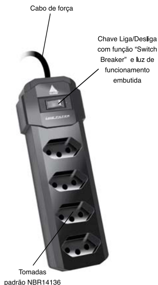
Plugue padrão NBR14136