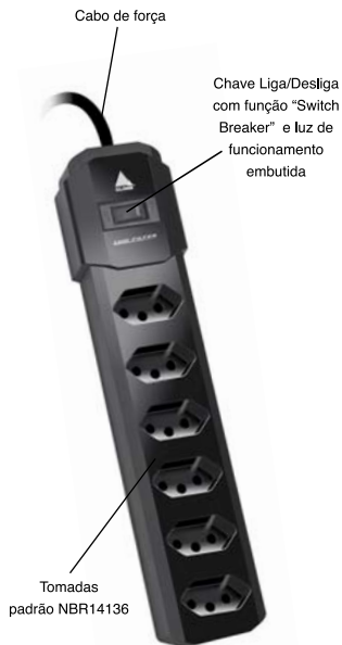
Plugue padrão NBR14136