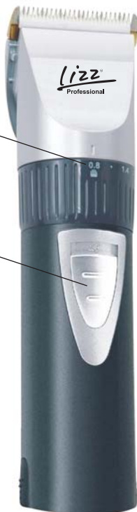
Anel de Regulação Fina: 0.8 à 2.0mm